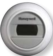
Voorbeeld van een kamerthermostaat

Met een kamerthermostaat kunt u de warmte in uw woning nauwkeurig regelen. Ons advies is om 's nachts de temperatuur 2 à 3 graden lager in te stellen dan overdag. Dit bespaart veel energie, terwijl uw huis 's ochtends toch snel op temperatuur is. Er zijn ook programmeerbare kamerthermostaten (klokthermostaten), waarmee u op vaste tijden een bepaalde temperatuur kunt instellen.