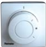
Voorbeeld van een centrale schakelaar ('nachtverlagingschakelaar')

Vaak worden thermostatische radiatorkranen gecombineerd met een centrale schakelaar, ook wel nachtverlagingschakelaar genoemd. Daarmee kunt u de warmte van alle radiatoren in uw woning in één keer regelen, bijvoorbeeld 's avonds als u naar bed gaat en 's ochtends als u opstaat. U hoeft dan niet alle radiatorkranen apart open of dicht te draaien.