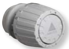
Voorbeeld van een thermostatische radiatorkraan

Hiermee kunt u de temperatuur per vertrek regelen. Zijn er meer radiatoren in één vertrek, dan kunt u het beste de kranen ervan op dezelfde stand zetten. Dat zorgt voor een gelijkmatige warmte.