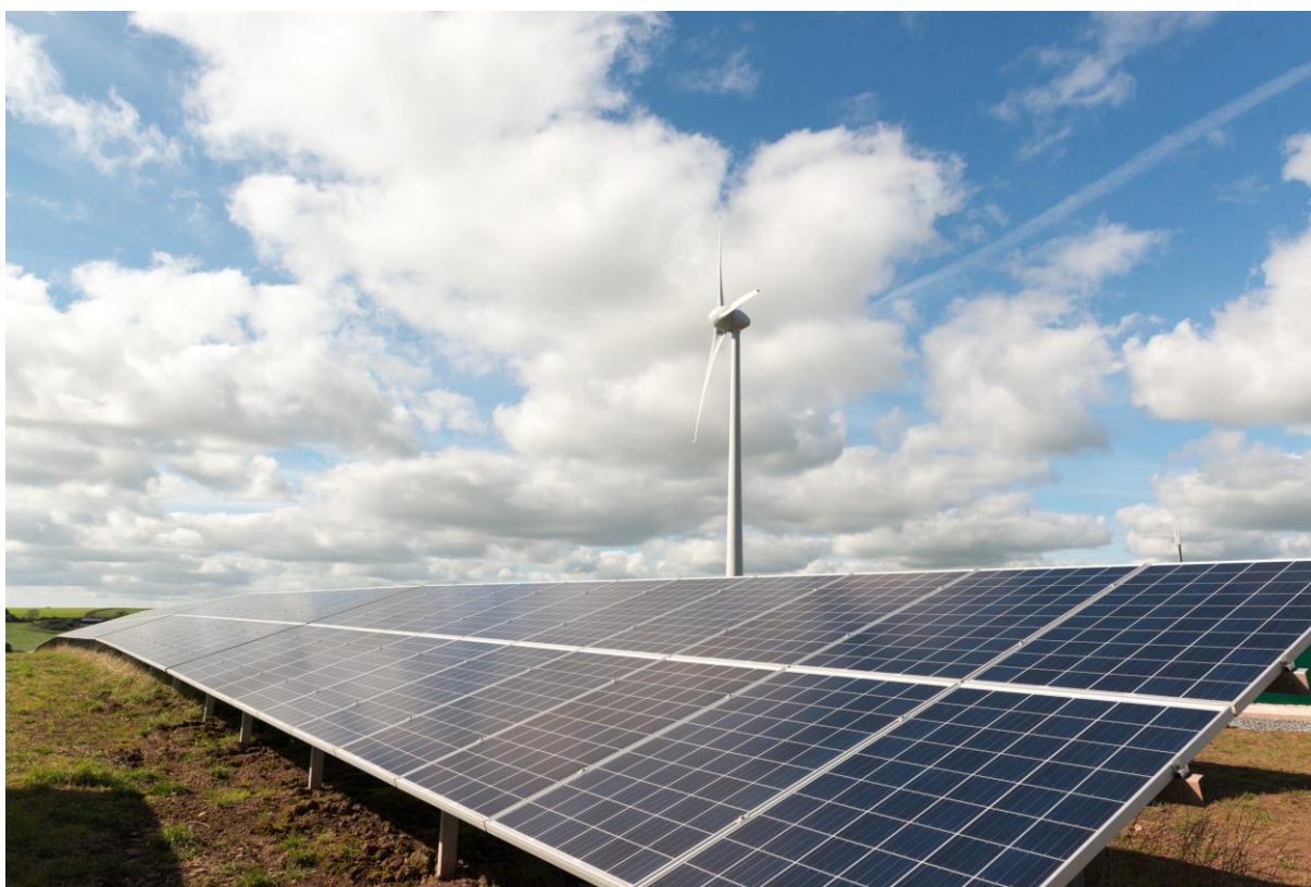
Foto: Vattenfall zonnepark Cynog in Wales

Let op! U belegt buiten AFM-toezicht. Geen prospectusplicht voor deze activiteit.