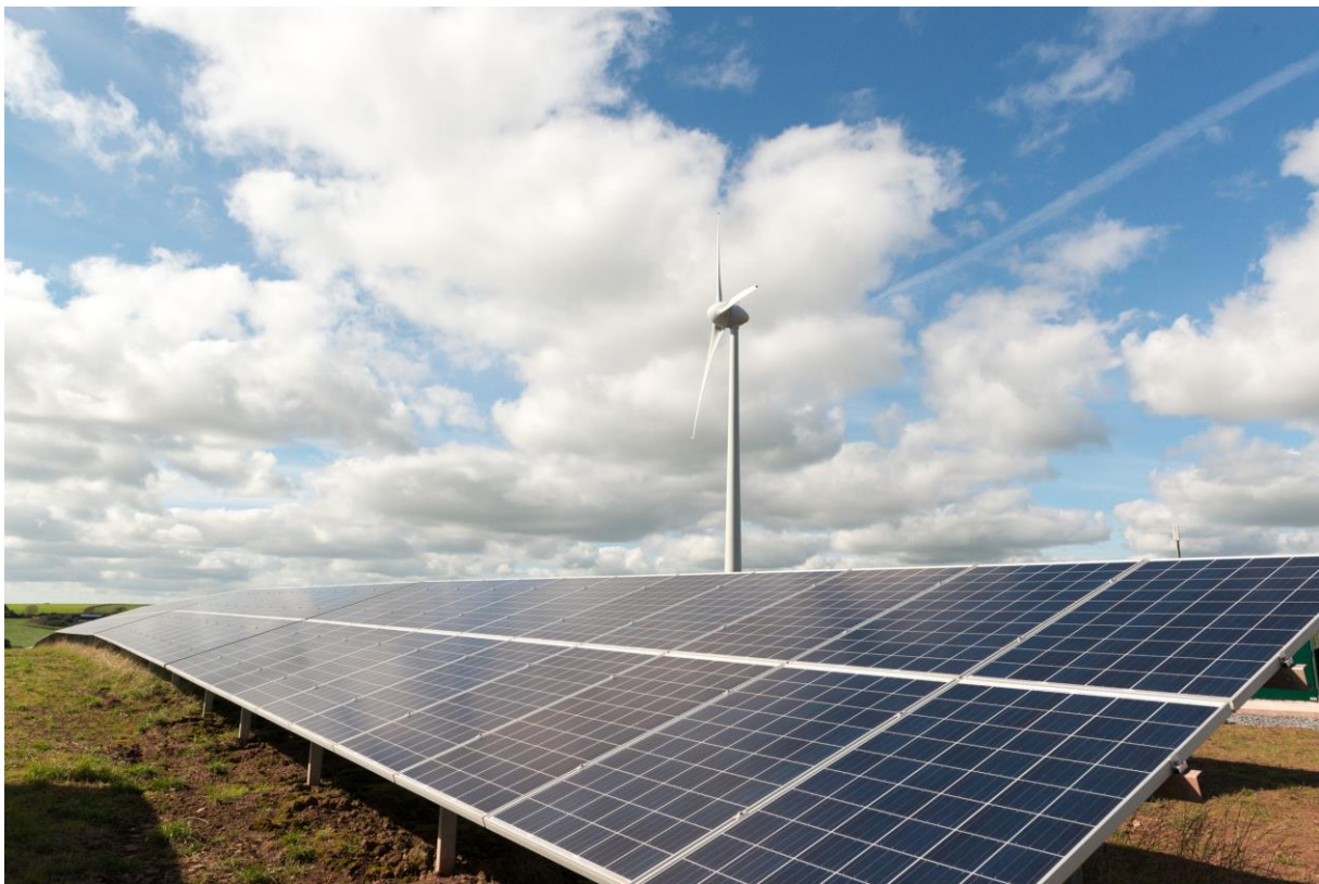
Foto: Vattenfall zonnepark Cynog in Wales

Let op! U belegt buiten AFM-toezicht. Geen prospectusplicht voor deze activiteit.